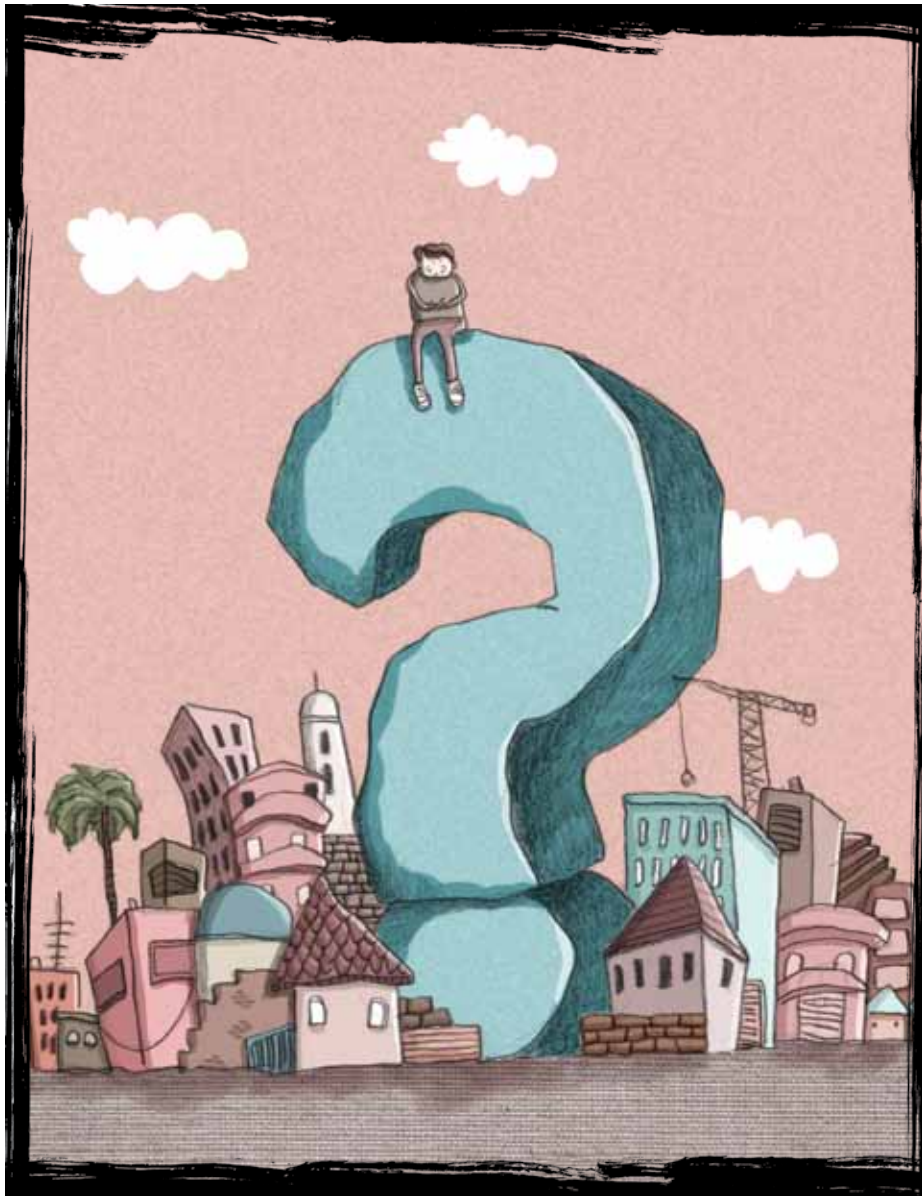
איור: אלעד ליפשיץ

שאיני אמור לדעת את התשובות: הכיבוש. הגזענות. ההפליה. הפליטים. תאגידי המים. הבדואים. הפרטה. הדרה. הפרדה.